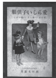
西村光惠著 1922 (大正 11)