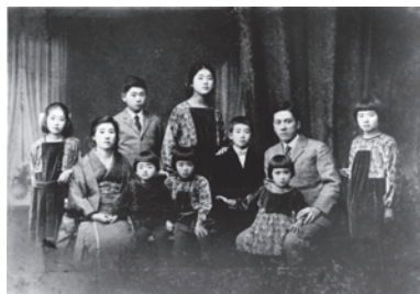
伊作の家族 1925 (大正 14)