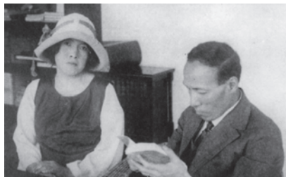
与謝野 寛・晶子 夫妻 1926 (大正 15)