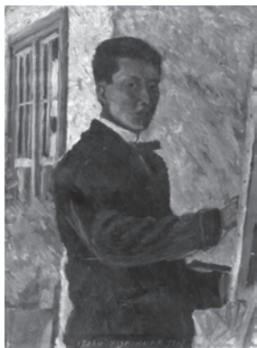
自画像 1913 (大正 3)