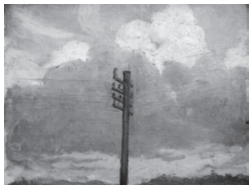
雲柱と雲 1914 (大正 3) 西村伊作