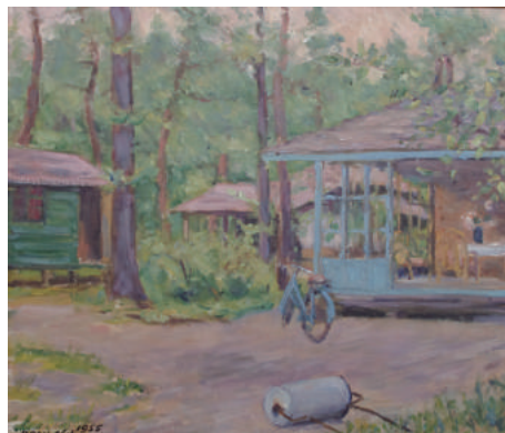
軽井沢の家とコテージ 油彩 西村伊作画 1955年