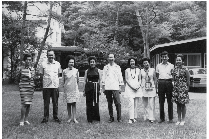
軽井沢の庭に集う9人の姉弟 1972年