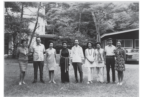
軽井沢の庭に集う9人の姉弟 1970年